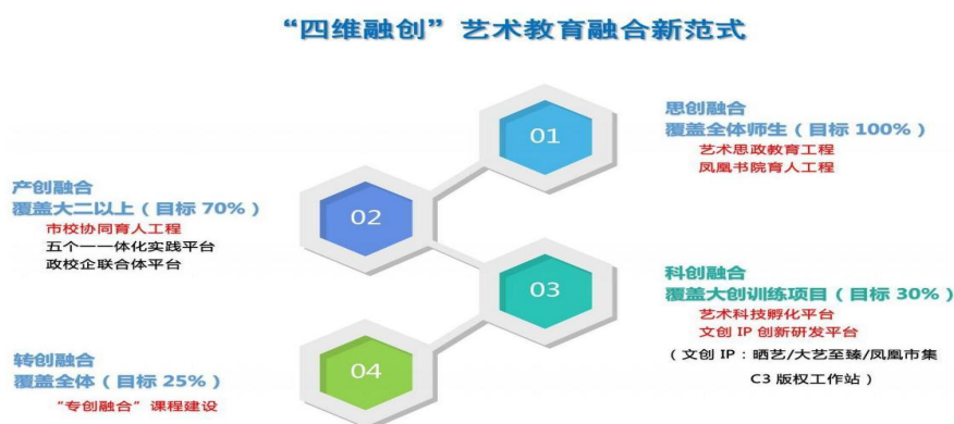
图1 “思维融创”艺术教育融合新范式

学校通过完善专创融合知识架构和量化评价，促进教学过程与内容、教学方法和手段的融合，促进专业教师成长为双创教育主体，挖掘和充实了艺术专业课程双创教育资源，链接了实践教学、学科竞赛、众创空间和文化科技创意园，形成双创教育实践体系和双创成果转化整合体系。